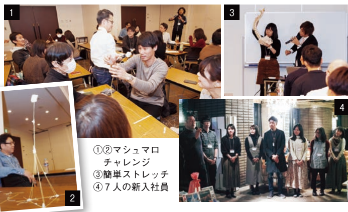
①②マシュマロ チャレンジ ③簡単ストレッチ ④7人の新入社員