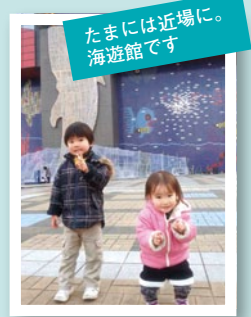
たまには近場に 海遊館です