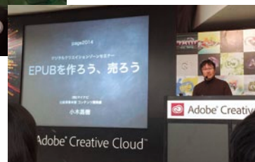
電子書籍のセミナー