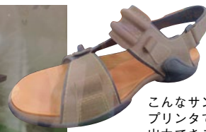
こんなサンダルも プリンタで 出力できる