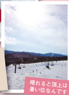
晴れると頂上は 暑い位なんです

今年の冬は各地で大雪に見舞われました。雪の珍しい大阪でも、人通りの少ない道路は通勤時、一面真っ白。そんな中でも雪を見て嬉しくなっちゃう私の趣味は、“スノーボード”です。