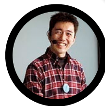
レポート・たけうちとおる