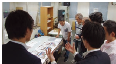
会社見学での説明もたびたび