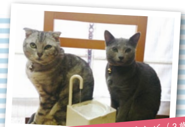
写真左：スコティッシュフォールド♂ シンバ (3歳) 写真右：ロシアンブルー♀ バロン (2歳)