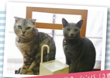
写真左：スコティッシュフォールド♂ シンバ (3歳) 写真右：ロシアンブルー♀ パロン (2歳)