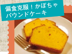
偏食克服！かぼちゃ パウンドケーキ

編集長特権！おねだりして味見させていただきました！ほんのりかぼちゃの味がして、おいしい！お母さんの味ですわ〜今度レシピ教えていただきます♪