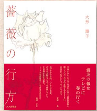
大形順子 『バラの行方』 2011年8月刊 160mm×188mm/170頁

驚くことに89歳まで現役で眼科医を開業してこられた先生は、92歳の今もかくしゃくとして句会の首座を務められ、長年の句友の皆様もほとんどが80歳以上ということで、私など若者扱いしていただけるのも心穏やかに時を過ごせる一因になっている。