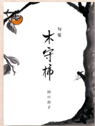
田口由子 『木守柿』 2012年10月刊 148mm×200mm/226頁

別の句集を豪華版で出版されたWさんは、「これは兄の日記だ」とおっしゃっていたが、本当に句には人の性(さが)がでてしまうものだ、と最近やっとその奥深さが分りかけてきたところである。