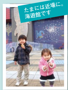
たまには近場に 海遊館です