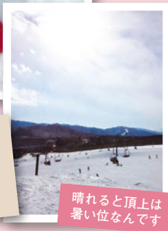
晴れると頂上は 暑い位なんです