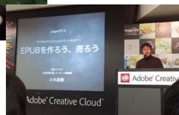
電子書籍のセミナー