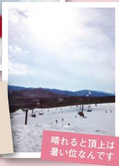
晴れると頂上は 暑い位なんです