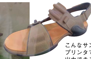
こんなサンダルも プリンタで 出力できる