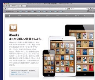
便利な電子書籍端末

さて、やはり「楽天-kobo」「Amazon-Kindle」あたりが強いように思えますが、こちらは専用端末だけでなくスマートフォン用アプリが出て来て、どの端末でも見れるようになってきました。また日本の電子書籍ではいまいち影が薄いAppleのiBookStoreですが、こちらも日本語書籍が揃ってきてアプリと同じような感じで買えるので便利です。