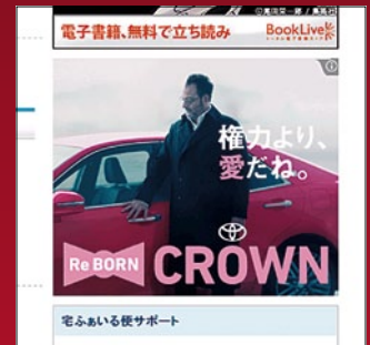
ブログに表示される広告